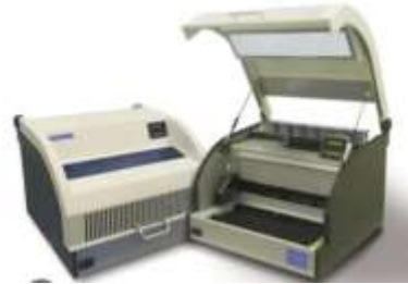
Gambar 1 GT Blot 48

Prinsip Kerja Instrumen GT Blot 48 adalah alat pencuci hibridisasi otomatis yang menginkubasi strip LPA pada suhu yang sesuai dan melakukan berbagai langkah inkubasi dan pencucian secara otomatis