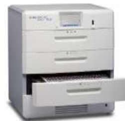
Gambar 2 Instrument MGIT 960

Instrument MGIT 960 merupakan instrument yang digunakan untuk menginkubasi kultur dan DST pada suhu 37° C dengan monitoring fluorescence secara terus menerus.